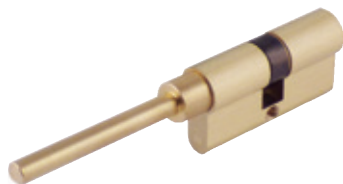
CYLINDRE AVEC AXE RÉGLABLE