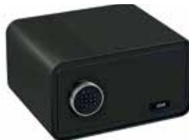
SAFESTONE 430 Ouverture à code