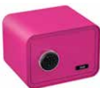
SAFESTONE 350 Ouverture à code