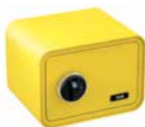
SAFESTONE 350 Ouverture à empreinte digitale