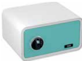
SAFESTONE 430 Ouverture à empreinte digitale